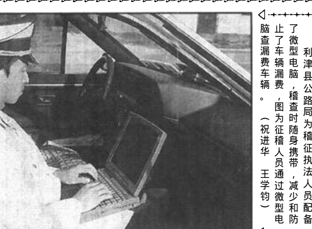
利津县公路局为稽查执法人员配备微型电脑，稽查时随身携带，减少和防止了车辆漏费现象。（祝进通 王宇钧）

充分证实，经营者只有生产出消费者使用方便的产品，就能占领市场的制高点。所以说，在人们不断追求方便、快捷、舒适的情况下，只此，经营者们谁能通过细心地观察发现消费者的“不方便”之处，它就会给自己的产品占领市场带来机遇。在此，笔者提醒经营者们要学会透过方便找市场，从而去准确把握企业发展的切入点。