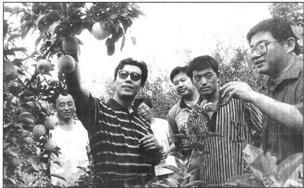
镇上农技讲师团 帮俺养殖赚大钱

率在99%以上，查处各类违建49处，建筑面积77084平方米，并对12家不服从管理违法施工的单位通过电视台进行了曝光，收到了很好的效果；对西四路、济南路、淄博路、西二路、青岛路、商河路等主要路段进行了重点整治，累计拆除板房15间，225平方米，棚亭26处，1320平方米，铁皮房14个，清理洗车台80余个，乱摆摊点3000余处，乱挂横幅20余条，治理店外经营800多家；发放临建规划许可证15件，面积1769平方米。 以抓基础工作入手，加强环境卫生的日常管理工作，环境面貌有了较大改善。为调动环卫工人的积极性，提高了一线工人的工资，道路清扫工工资由180元提高到260元，垃圾处理工、清运司机、垃圾收集工工资由320元提高到450元。主要街道达到全天候保洁，垃圾实现日产日清，日清日运。目前共清运生活垃圾47000方，建筑垃圾渣土25000方，清运费便4700吨。（李学宝 田力）